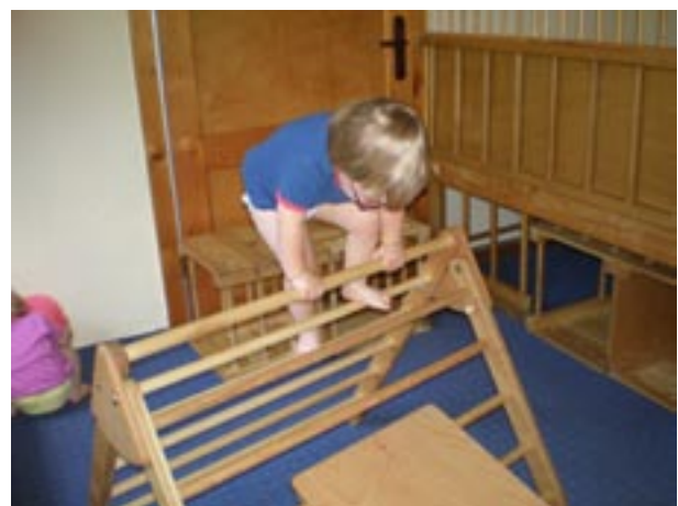
Amelie steigt das Pikler-Dreieck im Nachstellschritt hoch, sichert ihr Gleichgewicht, indem sie sich mit beiden Händen festhält.