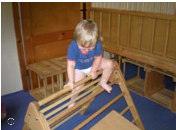
Amelie übersteigt mit dem linken Bein das Dreieck, ist unsicher und nimmt das Bein wieder zurück.