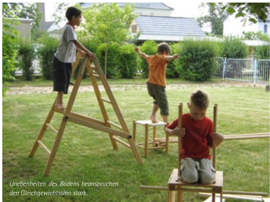
Unebenheiten des Bodens beanspruchen den Gleichgewichtssinn stark.