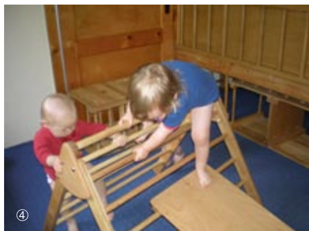
Ihr Gleichgewicht sichert sie durch das Festhalten mit beiden Händen.